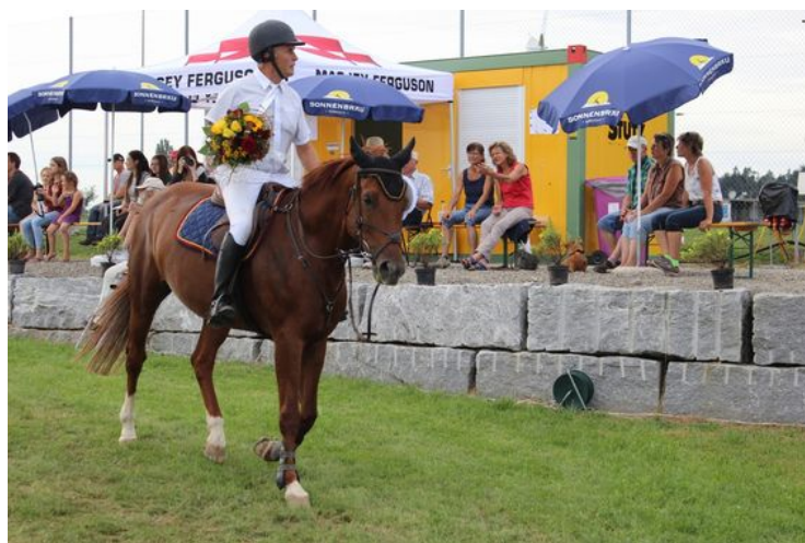
3/3 Der Doppelsieger.

Vom 2. bis 4. September gingen in Berg die 36. Pferdesporttage über die Bühne. Viele Besuchende erfreuten sich dem spannenden Reitsport Wochenende.