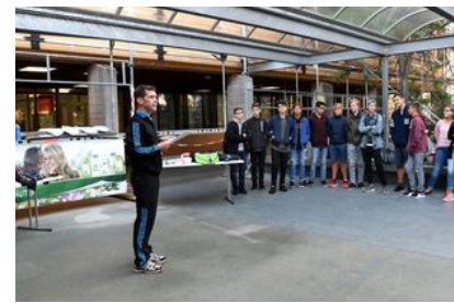
Schülertriathlon SSZ Egelsee